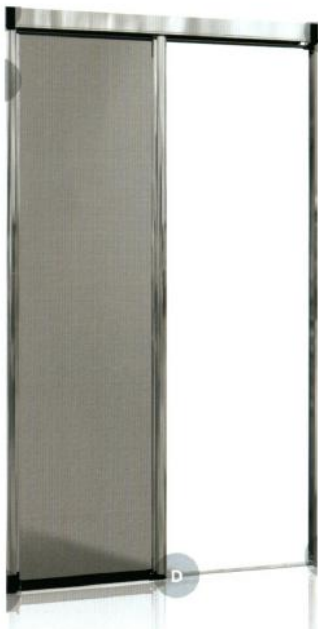
DIVINA A 1 ANTA

Mod: Divina , zanzariera a scorrimento laterale con soglia inferiore ribassata a mm. 3. Ideale per porte finestre, con spazi di fissaggio ridotti, grazie all'ingombro massimo di 39mm. Realizzabile a una o due ante. Scorrimento laterale frizionato, che consente un'apertura controllata e il posizionamento in qualsiasi posizione desiderata. Chiusura magnetica. Disponibile nelle varianti GOLD, dotata di profilo di riscontro e chiusura magnetica, e SILVER, assenza del profilo di riscontro e chiusura con spazzolino. Telaio in alluminio con svariati colori disponibili: standard, marmo, martellinati, speciali, legno verniciati e sublimati. Rete in fibra di vetro disponibile nelle tonalità grigio o nero a richiesta.