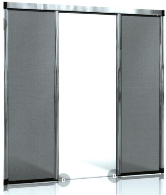
DIVINA A 2 ANTE