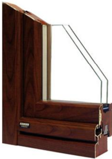
ESTERNO : ALLUMINIO

Mod: Stratec , infixo in legno-alluminio con accoppiamento a 90° negli angoli, a rilievo fugato, dei profili di alluminio (sistema brevettato). Sez. anta 68x79mm; sez. telaio 64x70mm; vetrocamera 28mm basso emissivo; tripla guarnizione a norma UNI 9122/2 a tenuta termica e acustica; zoccolatura doppia su balcone con soglietta h=49mm; ferramenta anti-effrazione 1° livello di sicurezza con chiusura perimetrale a più punti di bloccaggio con finitura Silver e meccanismo A/R. U_f = 1,60 \text{ W/m}^2\text{K} .