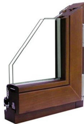
INTERNO: LEGNO ESSENZA TEAK FJ